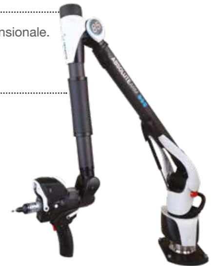
SISTEMA CAD CAM E METROLOGIA