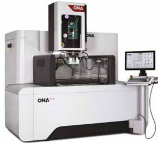
ELETTROEROSIONI A TUFFO E A FILO

ONA offre le soluzioni più vantaggiose ed ecologiche, esistenti nel campo dell'elettroerosione. Questa continua ricerca ha permesso di essere Leader mondiali nella produzione di macchine per elettroerosione speciali e di grandi dimensioni.