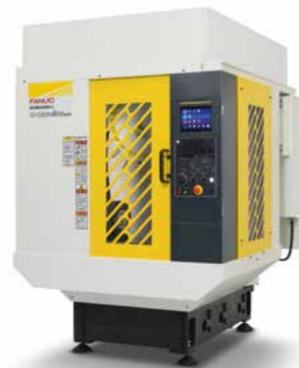
CENTRI DI LAVORO 3 4 5 ASSI

I centri di lavoro Fanuc sono affidabili, prevedibili e facili da riparare. Sono fatti per avere il tempo di funzionamento più alto del mercato. Fanuc Robodrill è il centro di lavorazione verticale progettato per la massima efficienza.