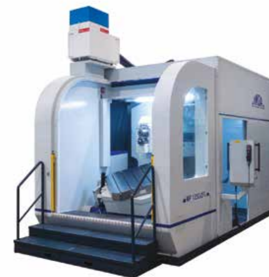
MACCHINE PER LA FORATURA

Fondata nel 1988 IMSA costruisce macchine per la foratura profonda nel settore stampi, blocchi meccanici e pezzi cilindrici, nel settore automotive, oleodinamico, meccanica di precisione. Più di 520 macchine foratrici IMSA lavorano nel mondo presso aziende di dimensioni piccole o grandi. I modelli base vengono adattate alle necessità dei clienti per rispondere alle esigenze più diffuse.