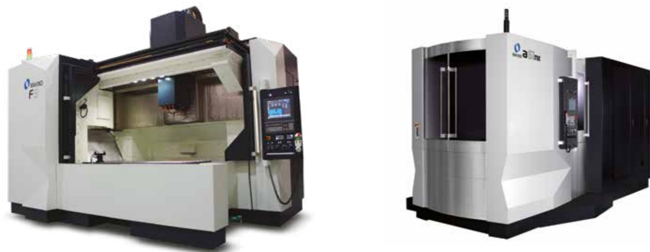
CENTRI DI LAVORO ORIZZONTALI E VERTICALI ELETTOEROSIONI A TUFFO E A FILO

Ala Makino la precisione è un atteggiamento mentale, vista la qualità, l'affidabilità, la stabilità e la sicurezza dei prodotti. Questo fa di Makino il punto di riferimento nella costruzione macchine per stampi, produzione e aerospace.