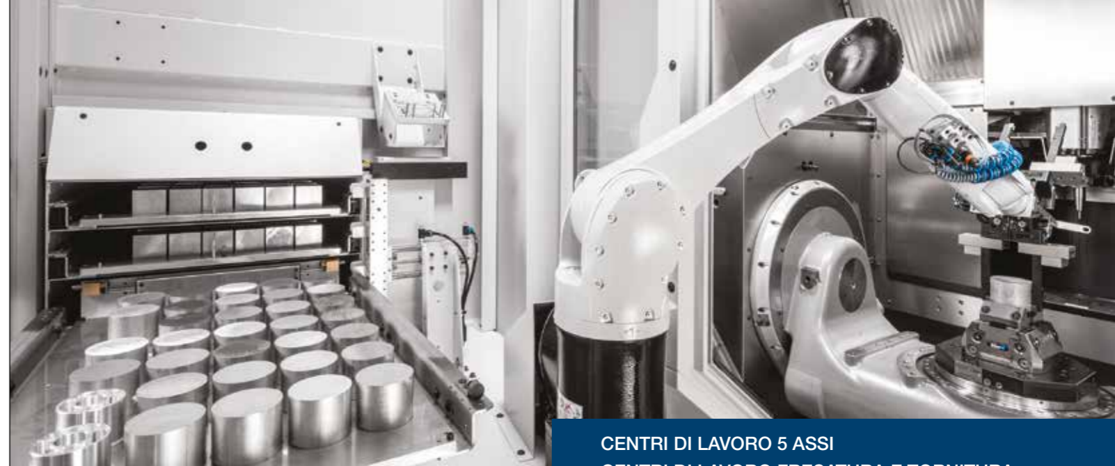
CENTRI DI LAVORO 5 ASSI CENTRI DI LAVORO FRESATURA E TORNITURA

Abbiamo selezionato sul mercato italiano ed internazionale i nostri fornitori per poter offrire la miglior tecnologia disponibile.