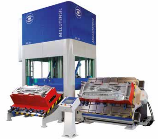
PRESSE PROVA STAMPI

Azienda italiana nata nel 1955, conosciuta nel mondo grazie al successo delle presse prova stampi di altissima precisione pensate per facilitare l'aggiustaggio, il controllo e la manutenzione degli stampi in sicurezza.