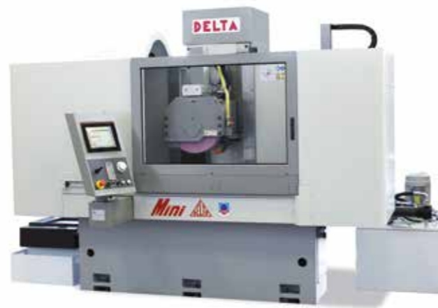
RETTIFICATRICI TANGENZIALI A MONTANTE MOBILE

Rettifiche Made in Italy dal 1955, macchine idrostatiche con architettura a montante mobile, caratteristica comune a tutte le rettificatrici proposte da Delta.