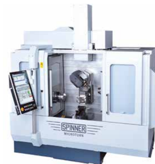
TORNI ULTRAPRECISI PER LAVORAZIONI TEMPRATO TORNI UNIVERSALI CENTRI DI LAVORO VERTICALI 3 - 5 ASSI